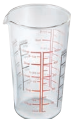
HARIO 玻璃量杯 500 CMJ-500

C/T 24 長 86 寬 81 口徑 81mm 容量 200ml 材質: 耐熱玻璃