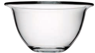
P-59414 900cc 耐熱多功能調理碗 H: 92mm φ: 170mm 1x6