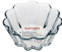
P-59654 BORCAM DAKE DISHES 250cc 耐熱花瓣烤碗 H: 50 mm Φ: 118 mm 24