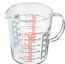
HARIO 手把量杯 500 CMJW-500

C/T 24 長 118 寬 81 高 87 口徑 81mm 容量 200ml 材質: 耐熱玻璃