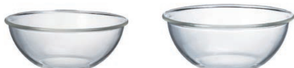
淺型調理鉢 2 入組 MXPA-2806

C/T 18 SS 長 86 寬 82 高 50 口徑 82mm 實用容量: 100ml 材質: 耐熱玻璃 S 長 113 寬 105 高 60 口徑 105mm 實用容量: 200ml 材質: 耐熱玻璃 M 長 137 寬 131 高 60 口徑 105mm 實用容量: 200ml 材質: 耐熱玻璃