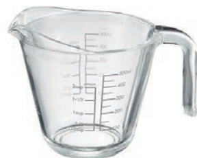
MJP-500 C/T12 HARIO 玻璃好握量杯 500

【長 105 · 寬 109 · 高 98 · 口徑 109mm】 【實用容量】250ml 【材質】耐熱玻璃