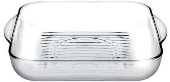
P-59874 BORCAM GRILL 3250cc 耐熱方形油切烤盤 H: 60mm φ: 317.5x282.5mm 1x6