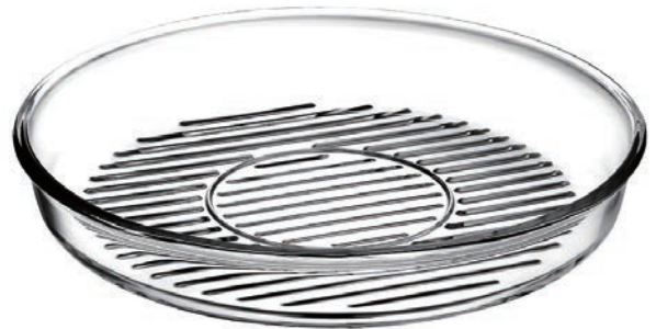
P-59544* BORCAM GRILL 2850cc 耐熱圓形油切烤盤 H: 50mm φ: 318.5mm 1x6