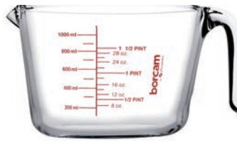
P-59186 BORCAM MIX&PREP 1000cc 耐熱強化量杯 H: 114mm φ: 163.5mm 單入彩盒