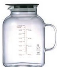
VFP-1000-B 維納格水果醋壺 1000

C/T 24 長 130 寬 90 高 141 口徑 73mm 容量 500ML 材質: 耐熱玻璃 . PP. 矽膠