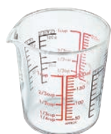
HARIO 玻璃量杯 200 CMJ-200

C/T 24 長 86 寬 81 口徑 81mm 容量 200ml 材質: 耐熱玻璃