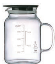
VFP-500-B 維納格水果醋壺 500

C/T 24 長 150 寬 105 高 120 口徑 105mm 容量 500ml 材質: 耐熱玻璃