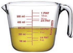
P-59176 BORCAM MIX&PREP 500cc 耐熱強化量杯 H: 114mm φ: 125mm 單入彩盒