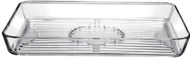
P-59554* BORCAM GRILL 3850cc 耐熱長方形油切烤盤 H: 50mm φ: 400x270mm 1x6