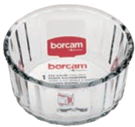
P-59624 BORCAM CAKE DISHES 240cc 耐熱舒芙蕾烤碗 H: 50 mm Φ: 100mm 24