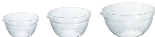
片口調理鉢 3 件組 KB-1318

C/T 18 SS 長 86 寬 82 高 50 口徑 82mm 實用容量: 100ml 材質: 耐熱玻璃 S 長 113 寬 105 高 60 口徑 105mm 實用容量: 200ml 材質: 耐熱玻璃 M 長 137 寬 131 高 60 口徑 105mm 實用容量: 200ml 材質: 耐熱玻璃