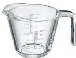
MJP-250 C/T12 HARIO 玻璃好握量杯 250

C/T 24 長 150 寬 110 高 166 口徑 73mm 容量 1000ML 材質: 耐熱玻璃 . PP. 矽膠