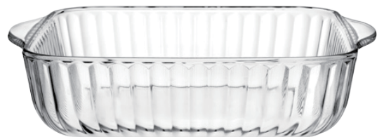
P-59384 BORCAM ROASTERS 1950cc 耐熱直紋長方形烤盤 H: 59.25mm φ: 256x220mm 1x10