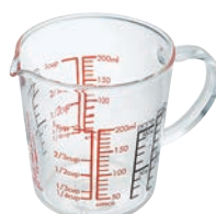
HARIO 手把量杯 200 CMJW-200

C/T 24 長 99 寬 91 口徑 91mm 容量 500ml 材質: 耐熱玻璃