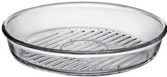
P-59534 BORCAM GRILL 1720cc 耐熱圓形油切烤盤 H: 45mm φ: 260mm 1x6