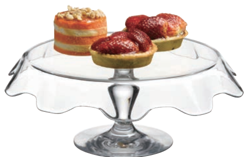
P-95105* PATISSERIE 造型點心盤 H: 150mm Φ: 320mm 1x2