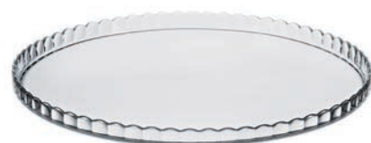
P-10345 PATISSERIE 蛋糕盤 下座 H:16mm Φ: 322mm