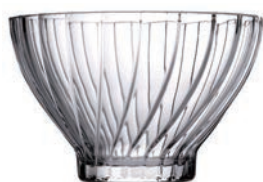
P-530216 BOUQUET 195cc 流線點心碗 H: 63 mm φ: 99 mm 6x4