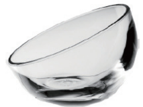
A-617801 135cc 斜口沙拉碗 H: 78mm \phi : 120mm 12 入