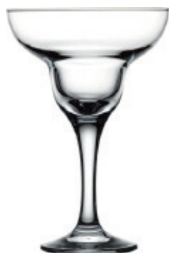
P-44386 CAPRI 305cc 瑪格麗特冰淇淋杯 H: 169 mm φ: 115 mm 12x1