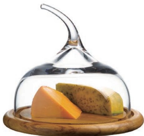
WP-18447* 原木起司盤 + 手工玻璃罩 (小) H: 165 mm φ: 175 mm 上蓋 H: 80 mm φ: 180 mm 底座 H: 15 mm φ: 220 mm 1x2