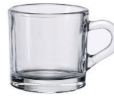
H-0080 80cc 咖啡杯 H : 56mm Φ : 54mm