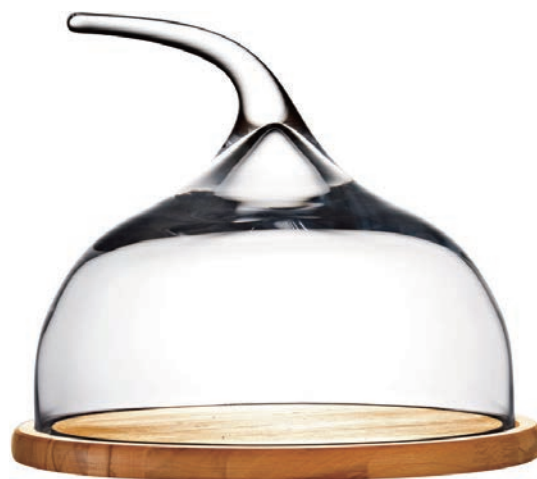
WP-18315* 原木起司盤 + 手工玻璃罩 (大) H: 250 mm φ: 270 mm 上蓋 H: 110 mm φ: 270 mm 底座 H: 15 mm φ: 300 mm 1x2