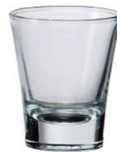
LG-440503 80cc 烈酒杯 H : 70mm φ : 59mm 12x12