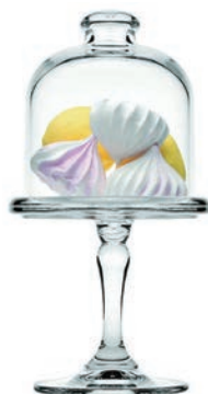
P-96456 MINI PATISSERIE 優雅點心盅 H: 198 mm φ: 100 mm 1x12