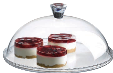
P-95198 高級蛋糕盤 上蓋 H:147mm Φ: 300mm 下座 H:20mm Φ: 322mm 1x2