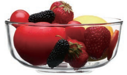
UG317 325cc 沙拉碗 H: 52.5mm φ: 113.3mm 6x12