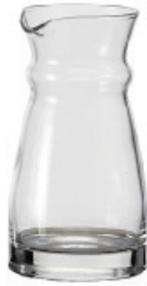
F-J4463-B 280cc 分酒器 (壓嘴) H : 130mm φ : 57mm 48