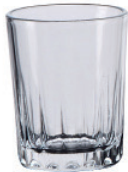
UG351 54cc 線條小酒杯 H : 58mm φ : 46mm 6x24