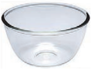
LG-222003 6 公分主廚碗 (50cc) H: 32.70mm φ: 60mm 12x12