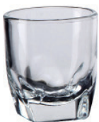
LG-440902 45cc 斜角烈酒杯 H : 55mm φ : 47mm 12x12