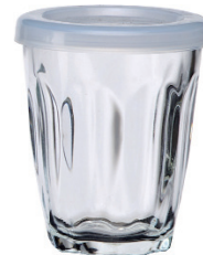
UG344PE 136cc 花俏八角杯 加蓋 H : 79mm φ : 64mm 6x24