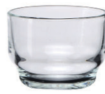
LG-404404 110cc 甜點杯 H : 68mm φ : 51mm 12x12