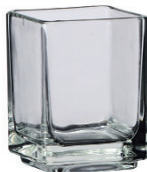
MH-78356-1 110cc 四方杯 H : 68mm Φ : 53mm CT : 60 1 件 : 120 入