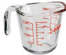
A-55175 250cc 強化有柄量杯 / 4 入 H: 100mm \phi : 92mm