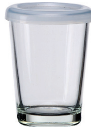
M-143 143cc 杯罐 H : 84mm Φ : 63mm CT : 12 1 件 : 96 入