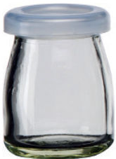
T-V085 85cc 布丁瓶 H : 75mm Φ : 51mm CT : 96 1 件 : 192 入