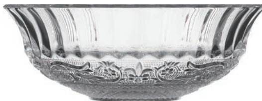
UG129 1274cc 鑽石碗 H: 69.7mm φ: 197.2mm 6x4