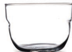
P-43713 MOTTO 200cc 可疊點心碗 H: 57 mm φ: 82 mm 6x16