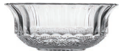
UG135 256cc 鑽石碗 H: 52.2mm φ: 115.2mm 6x12