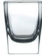
F-L7810 60cc 厚底四方杯 H : 63mm φ : 50mm 12x12