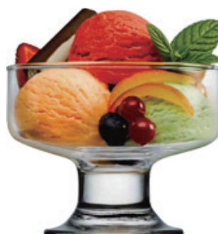
P-41016 ICE VILLE 265cc 聖代杯 H: 81 mm φ: 100 mm 6x4