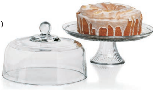
A-86475 二用高腳蛋糕盤 (含蓋) 上蓋 H: 170mm \phi : 255mm 底座 H: 120mm \phi : 300mm