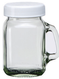
M-0120-W 120cc 有柄杯 (白蓋) H : 85mm Φ : 44mm CT : 60 1 件 : 120 入