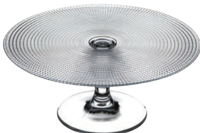
P-95240* PATISSERIE 點心盤 H: 112mm Φ: 280mm 1x4