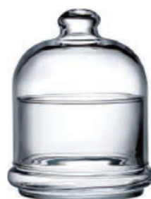
P-96966 果醬盅 上蓋 H: 95mm φ: 80mm 底座 H: 60mm φ: 75mm 1X24