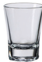
UG404 63cc 方底烈酒杯 H : 69mm φ : 53mm 12X12