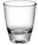
F-16166 50cc 烈酒杯 H : 59mm φ : 48mm 12x12