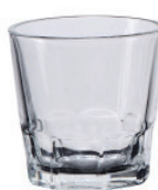
UG412 66cc 韓式燒酒杯 H : 53mm φ : 54mm 6x24