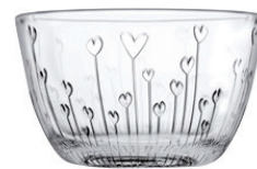
P-53896 MARMELADE 250cc 造型點心碗 H : 59 mm Φ : 100 mm 6x4