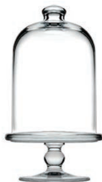
P-96696* MIDI PATISSERIE 高帽子點心盅 H: 230 mm φ: 110 mm 1x12