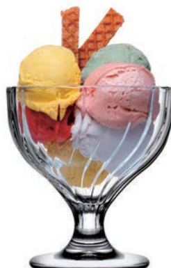
P-51819 BOUQUET 240cc 流線冰淇淋杯 H: 105 mm φ: 100 mm 2x12