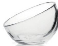
A-622301 45cc 斜口點心碗 H: 50mm \phi : 73mm 12 入