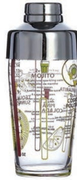
F-N1687 585cc 雪克杯 H:160.5mm