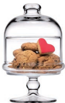
P-96386 MINI PATISSERIE 典雅巧克力盅 H: 184 mm φ: 110 mm 1x6