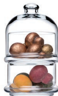
P-96985 VILLA PATISSERIE 高帽子點心盅 H: 160 mm φ: 76 mm 1x12