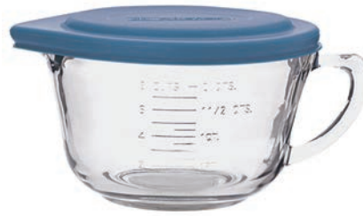
A-81106 2000cc 超大量杯 H: 145mm \phi : 220mm