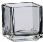
M-0069 TB-13131 69 燭台 (90cc) H : 55mm Φ : 51mm CT : 96