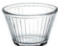
T P-53298 PUDDING 178cc 布丁碗 H : 58 mm Φ : 92 mm 24x2