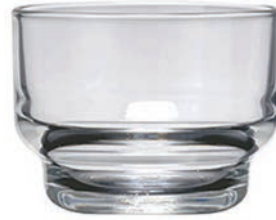
LG-404404 110cc 甜點杯 H: 68mm φ: 51mm 12x12