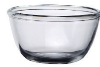
LG-222004 9 公分 主廚碗 (180cc) H : 48.70mm φ : 90mm 6x12