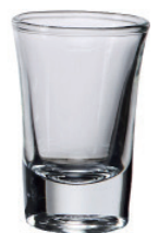
LG-440601 35cc 喇叭杯 H : 70mm φ : 45mm 12x12