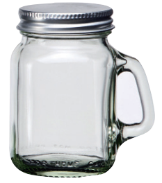
M-0120-S 120cc 有柄杯 (銀鋁蓋) H : 85mm Φ : 44mm CT : 60 1 件 : 120 入