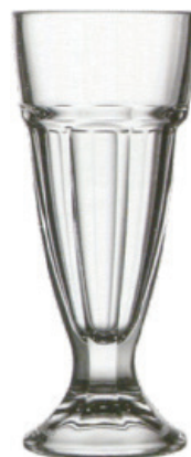
P-51128 ARCTIC 300cc 冰淇淋杯 H: 188 mm φ: 82 mm 2x14