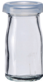
M-82939 119cc 牛奶瓶 H : 97mm Φ : 49mm CT : 140 1 件 : 140 入