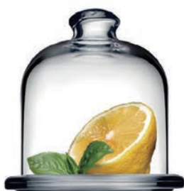
P-98397 甜點盅 上蓋 H: 95mm φ: 80mm 底座 H: 8mm φ: 100mm 1X12