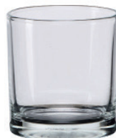
LG-404204 120cc 小直杯 H : 63.5mm φ : 61.5mm 12x12