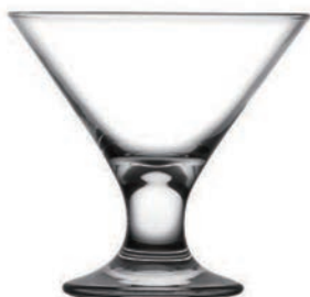
P-440410 ICE VILLE 200cc 點心杯 H: 99 mm φ: 105 mm 2x12