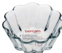
P-59654 BORCAM DAKE DISHES 250cc 耐熱花瓣烤碗 H : 50 mm Φ : 118 mm 24