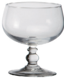
F-43294 530cc 雞尾酒杯 (火燒冰淇淋下座) H : 80mm φ : 40mm 6x4