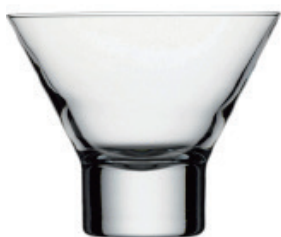
P-41813 PETRA 230cc 冰淇淋杯 H: 87 mm. φ: 106 mm 12x1