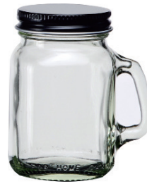
M-0120-B 120cc 有柄杯 (黑鋁蓋) H : 85mm Φ : 44mm CT : 60 1 件 : 120 入