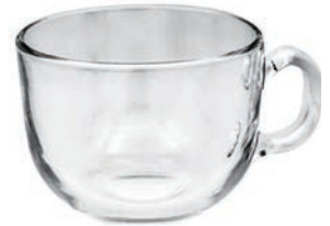
UG409 494cc 湯碗 H: 85mm φ: 106mm 6x6