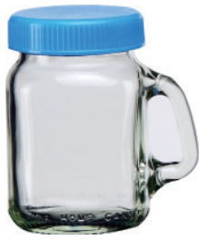
M-0120-BL 120cc 有柄杯 (藍蓋) H : 85mm Φ : 44mm CT : 60 1 件 : 120 入