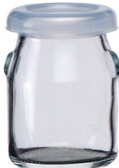
M-78327 100cc 有耳瓶 H : 80mm Φ : 50mm CT : 96 1 件 : 192 入