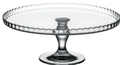
P-95117-U* PATISSERIE 高級蛋糕盤 (上) 下座 H:128mm Φ: 322mm 1x2