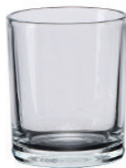
UG348 75cc 小直杯 H : 61mm φ : 52mm 6X24