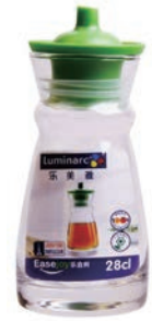
F-J9067 280cc 油醋瓶 H : 135mm φ : 55mm