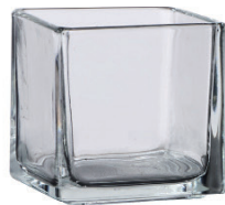
M-0104 104 燭台 (300cc) H : 78mm Φ : 75mm CT : 48