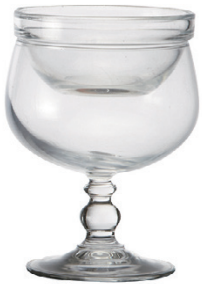
火燒冰淇淋組合 上座 : F-C7450 10CM 金剛碗 下座 : F-43294 530cc 雞尾酒杯