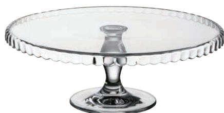
P-95117-D* PATISSERIE 高級蛋糕盤 (下) 下座 H:130mm Φ: 322mm 1x2