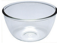
LG-222004 9 公分主廚碗 (180cc) H: 48.70mm φ: 90mm 6x12