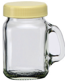
M-0120-Y 120cc 有柄杯 (黃蓋) H : 85mm Φ : 44mm CT : 60 1 件 : 120 入