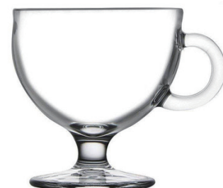
P-55182* VARIO 250cc 冰淇淋杯 H: 98 mm φ: 93.5 mm 4x6