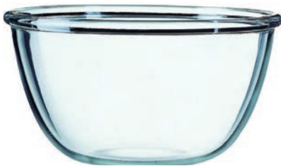
F-L41879 可可安 18 公分沙拉碗 (1500cc) H : 240mm φ : 180mm 6