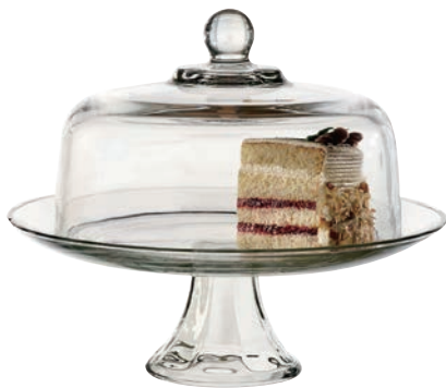
A-87892 二用高腳蛋糕盤 (含蓋) 上蓋 H: 180mm \phi : 285mm 底座 H: 120mm \phi : 320mm