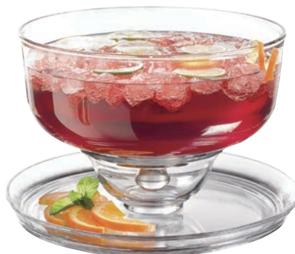
A-96841 三用高腳蛋糕盤 (含蓋) 上蓋 H: 180mm \phi : 285mm 底座 H: 80mm \phi : 315mm