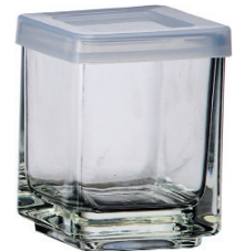
MH-78356 四方罐 H : 68mm Φ : 53mm CT : 60 1 件 : 120 入