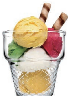
P-410006 MINI CORNET 245cc 沃福冰淇淋杯 H: 86 mm φ: 85 mm 3x8