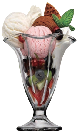
P-51068 CANADA 170cc 花式冰淇淋杯 H: 118 mm φ: 115 mm 6x2