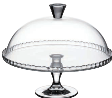
P-95200* 高級蛋糕盤 上蓋 H:147mm Φ: 300mm 下座 H:130mm Φ: 32xmm 1x2