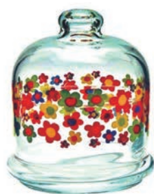
P-98973-1* 果醬盅 (花) 上蓋 H: 95mm φ: 80mm 底座 H: 60mm φ: 75mm 1X24