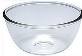
LG-222005 12 公分主廚碗 (405cc) H: 64.70mm φ: 119mm 6x12