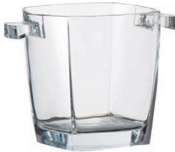
F-75524 方形冰桶 H : 155mm φ : 145mm 1x6