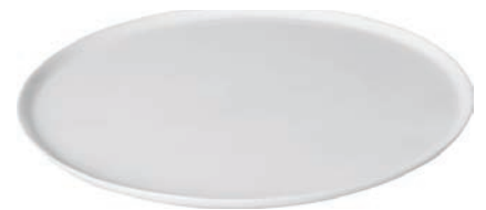
F-72287 白砗披薩盤 φ : 315 X315 mm 1