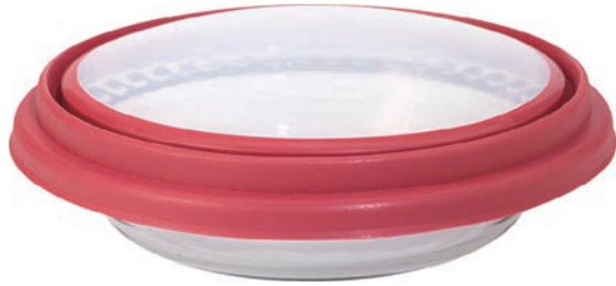
A-11461 有蓋烤盤 上蓋 \phi : 295mm 玻璃 H: 45mm \phi : 285mm