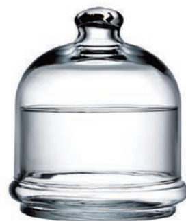
P-96814 巧克力盅 上蓋 H: 112mm φ: 112mm 底座 H: 70mm φ: 117mm 1x12