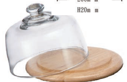
A-11650 蛋糕玻璃上蓋 H: 85mm \phi : 160mm