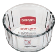
P-59624 BORCAM CAKE DISHES 240cc 耐熱舒芙蕾烤碗 H : 50 mm Φ : 100mm 24