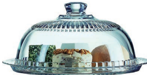
F-L41415 有蓋蛋糕派盤 上蓋 H: 270 mm Φ: 140mm 下座 H: 320 mm Φ: 20mm 1x2